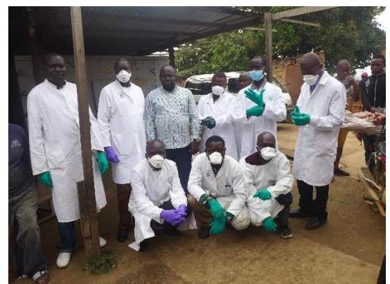
Fig 3. Scientifiques du CSB/UNIKIS et le conseil du ministre devant la chambre froide