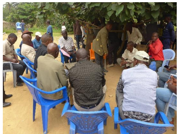
Fig 2. La délégation échange avec les notables