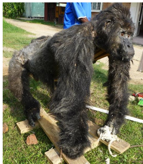
Fig 6. Gorille naturalisé exposé au soleil