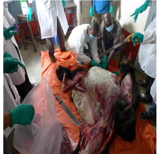
Fig 4. Dissection de la carcasse de la bête

Voici le Gorille de Bayanguma naturalisé par les techniciens du Musée de la Faculté de Sciences et du CSB/UNIKIS.