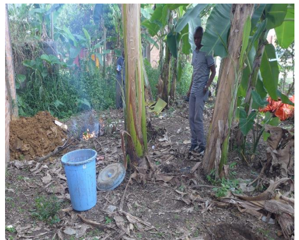
Fig 5. Incinération de la viande de Gorille