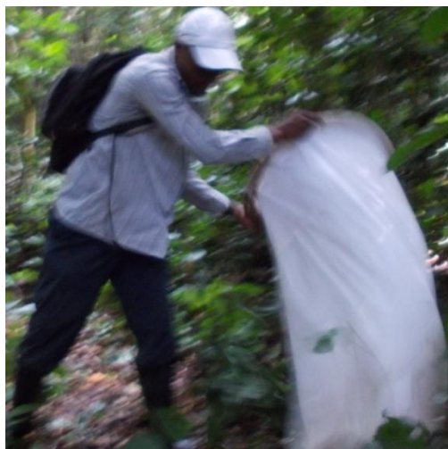
Fig.2a. Filet Faucheur