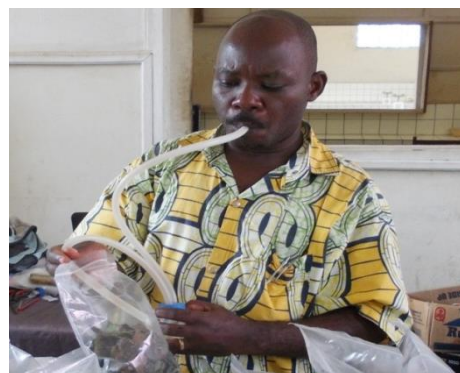
Fig.3. Aspirateur Pour aspirer les Parasitoïdes