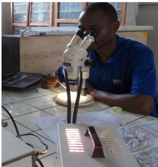
Fig. 4a. Observation aux binoculaires