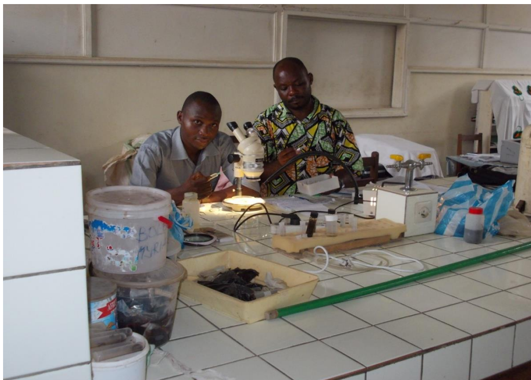
Fig. 4c. Manipulation après observation pour la conservation dans l'alcool à 70%

Cette conservation permet aux spécimens de garder leur forme intacte afin de permettre une étude qui pourra être menée ultérieurement.