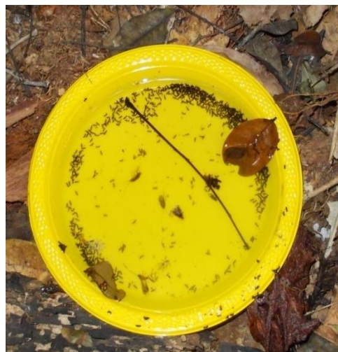
Fig. 2b. « Yellow Traps »