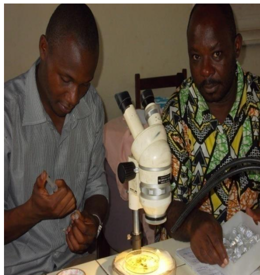
Fig.4b. Observation et conservation des spécimens