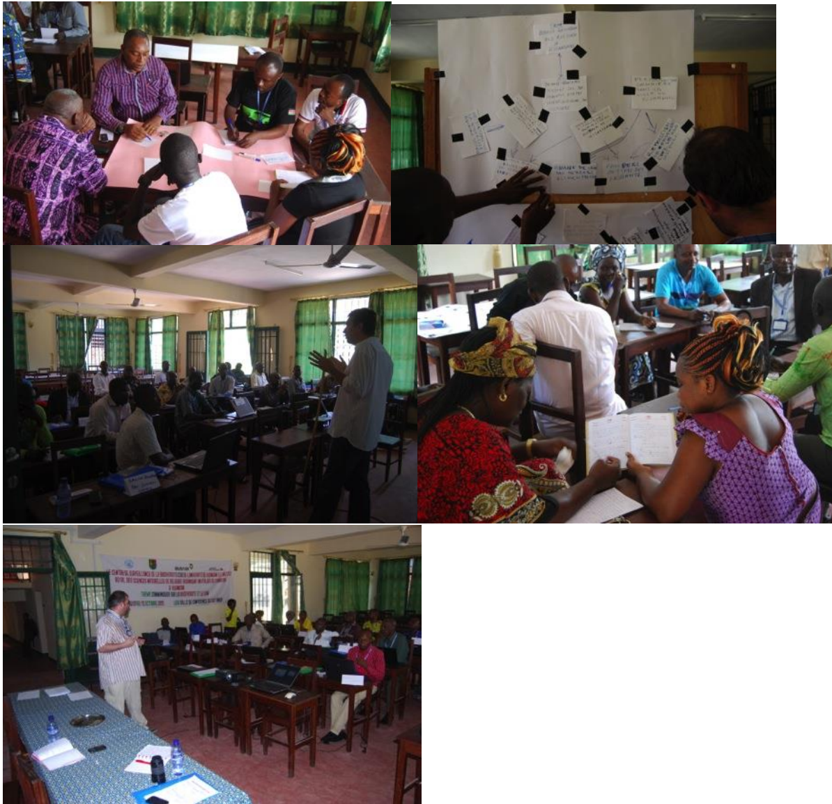
Formation sur l'écriture scientifique, travaux de groupe