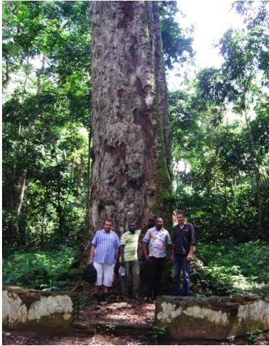
Arboretum de Yangambi