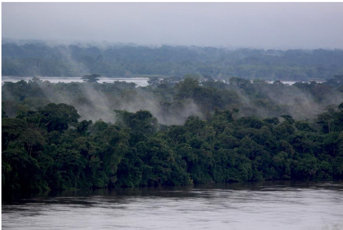
Vue sur le fleuve Congo à Yangambi