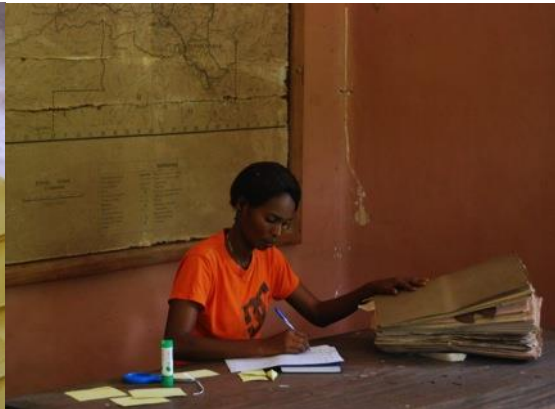
Collection zoologique et botanique de l'herbarium de Yangambi