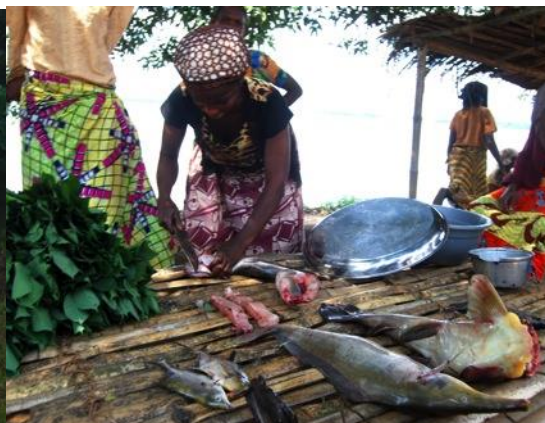
Petit marché aux poissons

L'herbarium : immense bâtiment rénové avec l'aide de Meise, fonctionnant sur l'énergie solaire. Lors de notre visite il y a une activité fébrile par une dizaine de personnel en train de classer des herbiers dans d'immenses armoires en métal. Nous avons eu un entretien avec M. Elasi Ramazani, conservateur très engagé. Pendant les heures noires du Congo, il n'a pas reçu de salaire pendant 6 ans. Il insiste pour avoir un support pour construire un site web afin d'augmenter la visibilité de cette