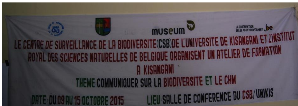
Banderolle de la formation