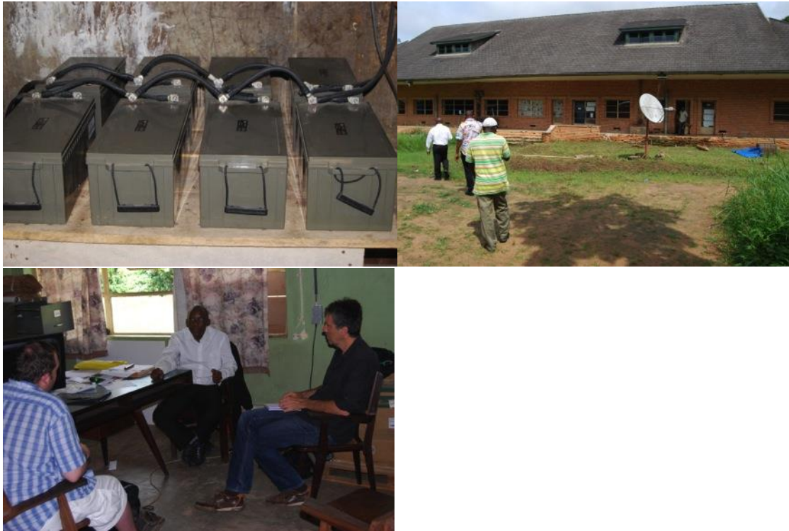
Groupe électrogène (batteries), herbarium, entretien avec le conservateur

Entretien avec le directeur de l'INERA: le FCC-REFORCO a donné des formations en informatique, REDD, géomatique, statistiques, comptabilité. Il y a une pépinière pour la production de semences pour le reboisement d'arbres indigènes (p.ex. pour la réserve de faune à okapi à Epulu). Les projets sur les semences et le reboisement se font en collaboration avec l'ONG OCEAN. Les arbres servent aussi à protéger les berges. Des pans d'avenue se sont écroulés lelongs des berges. Le changement climatique se fait aussi sentir, du moins c'est l'interprétation quand la petite saison sèche n'apparaît plus. L'INERA gère aussi l'IFA qui est la faculté d'agronomie. Il y a 10 camps de travailleurs à Yangambi, avec tous un petit dispensaire et au total 1 grand hôpital à 1 médecin. Le site recouvre 240.000 ha. Les salaires sont acheminés physiquement en provenance de Kisangani. Cela pose problème. L'agro-foresterie et les forêts communautaires sont en priorité dans leur recherche.