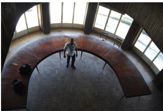
Bibliothèque de l'INERA

La station INERA de Yangambi compte plus de 950 agents actifs (> 1500 y compris 2 stations satellites).