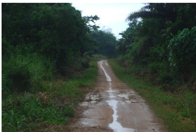
La piste entre Kisangani et Yangambi

La route : la route qui sort de Kisangani vers Yangambi devient vite une piste pas plus large que le véhicule, où la végétation reprend ses droits de part et d'autre. Un orage change la piste en patinoire pour le véhicule 4x4. Plusieurs petits ponts sur des ruisseaux jontent la piste. Puis nous devons traverser la rivière Lindi par bac. Cette rivière immense, affluent du fleuve Congo, est plus large que l'Escaut à Anvers et reçoit la Tshopo qui longe la ville de Kisangani un peu en amont avant de se jeter en aval du bac dans le fleuve Congo. La piste traverse plusieurs villages sans électricité ni eau où les gens ont l'air d'avoir juste un seau en plastique, quelques filets et de grandes chaises en bois traditionnelle comme uniques possessions. La guest house de l'INERA (Institut National de recherche Agronomique) est magnifiquement située avec une vue superbe sur la forêt et le fleuve Congo. Le site est très propre, et nous trouvons vite quelqu'un qui cuisine pour nous au charbon de bois (pas d'électricité).