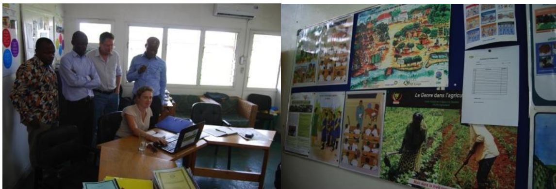
Visite au bureau VVOB, à Kinshasa, affiches éducatives dans le bureau

VVOB pense que ce sera aussi une bonne idée la prochaine fois de parler avec la CTB sur le secteur de l'éducation.