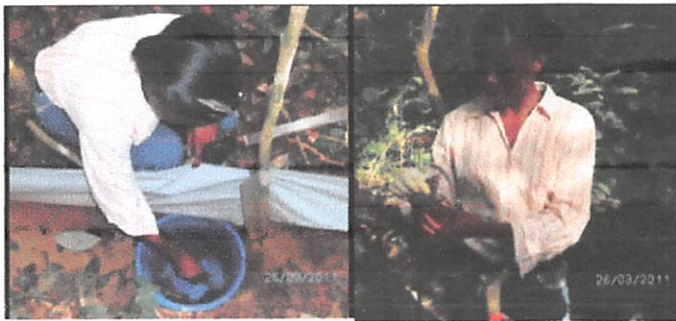
Fig. (3). Le relevé des spécimens dans les pièges.

Chaque bête capturée était tuée et gardée dans un sachet muni d'étiquette qui indiquait les coordonnées des pièges (type de piège, type d'habitat, numéro de la ligne et de la station). En cas de capture des Musaraignes dans le Sherman , le piège était remplacé et lavé le même jour afin d'éviter toute odeur pouvant entraîner la crainte d'autres bêtes. D'autre fois les photos ont été prises avec l'appareil numérique de marque Travel 1012 de 12.0 MegaPixel.