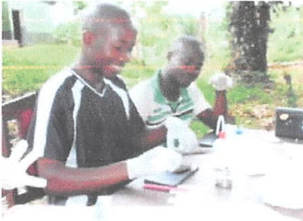
Fig. (5). La biopsie des spécimens capturés.

Nous avons utilisé la trousse à dissection stérile composée de gants, de paires de ciseaux, de bistouris, d'ouate et de l'alcool 96% pour le nettoyage des instruments. Les tissus prélevés (le muscle du cœur pour notre cas) étaient conservés dans des tubes Eppendorf contenant 1.5 ml d'alcool 96% avec de l'eau distillée.