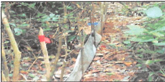
Figure(1). Le dispositif utilisé.

Schéma du dispositif de capture (fermé et ouvert) par rapport à l'orientation de la piste.