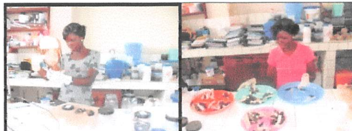
Fig. (4). Identification de spécimens au laboratoire général.