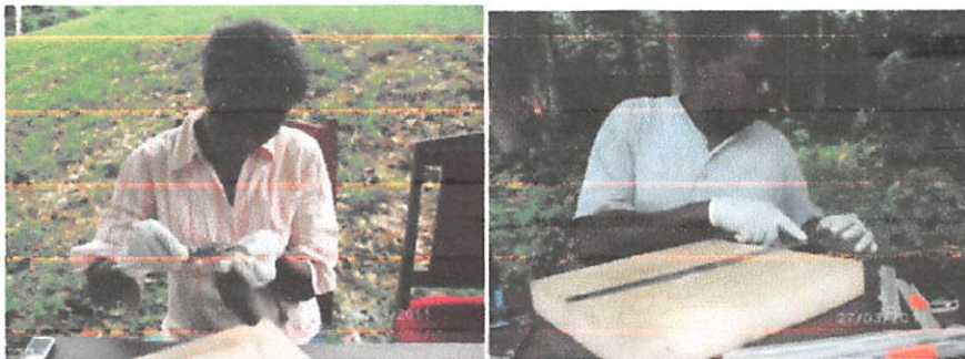
Figure (5) Les différentes mesures prises sur les betes.

Les différentes mesures prises sont entre autres: le poids (à l'aide de peson de marque Pesola, de 10g, 30g, 60g ou 100g selon le cas, la longueur du pied postérieur gauche sans mesurer le griffe sur l'orteil le plus long et celle de l'oreille gauche (à l'aide d'un pied à coulisse digital, de marque Wezu Electronic Digital Caliper. La longueur de la queue et la longueur totale (tête-corps-queue) étaient prises à l'aide d'une latte métallique graduée de 50 cm, marque chinoise).