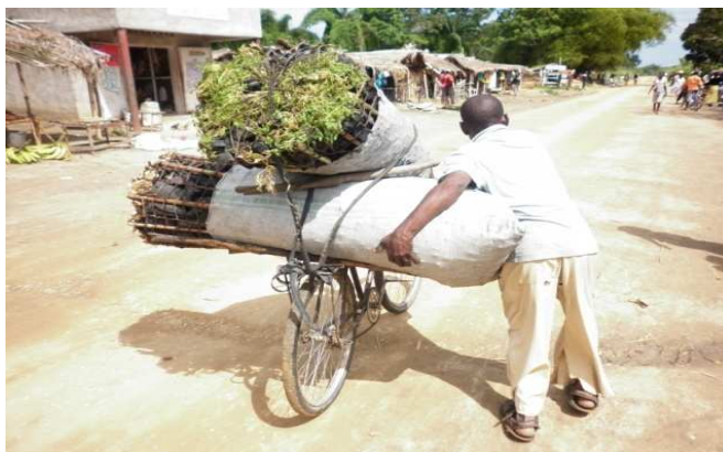
Photo 4 : Transport du charbon de bois vers le point de vente en détail.