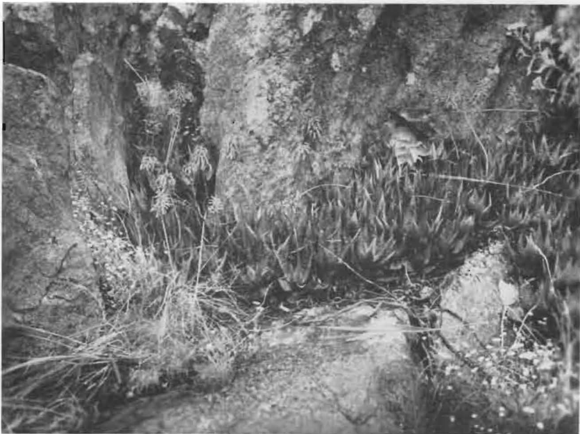
FIG. 2. — Rivière Toka.