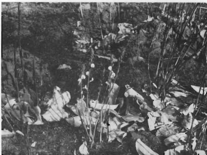
FIG. 2. — Rive droite de la rivière Muye.