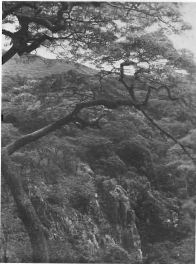
FIG. 1. — Vallée de la rivière Senze.