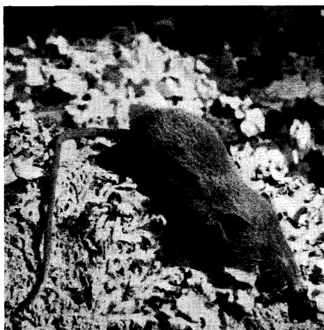
FIG. 5. — Sylvisorex sorella (O. THOMAS), ♂.

La photographie ci-dessous représente le spécimen n° 126.