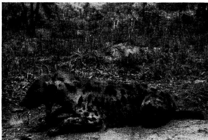
FIG. 4. — Crocotta crocuta (ERXLEBEN), ♀.

Les organes génitaux externes de deux mâles et de la femelle n o 500 ont été conservés en alcool; la photographie ci-dessous représente cette femelle. Des parasites (n o 282 C) ont été prélevés au même spécimen.