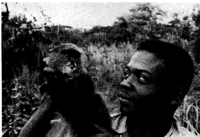
FIG. 1. — Cercopithecus mitis opisthictus P. L. SCLATER, ♀.

La collection comprend six spécimens abattus à Kanonga en septembre (les 15, 18 et 22 du mois) 1947 : 4 ♂ ♂ (n os 408, 416, 431, et 437) et 2 ♀ ♀ (n os 430 et 432, ce dernier jeune du précédent). Cinq de ces spécimens