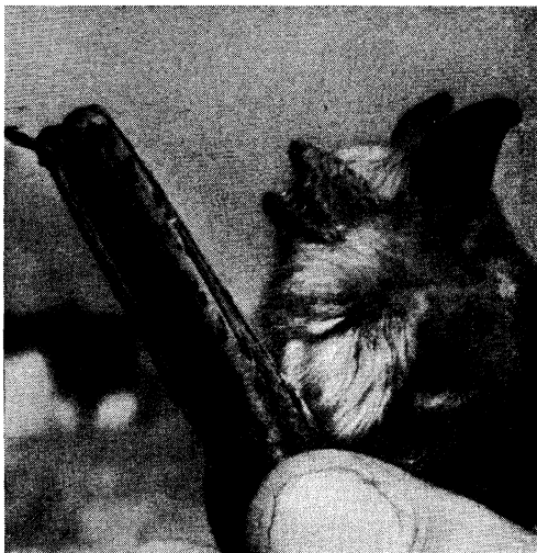
FIG. 3. — Myotis welwitschii (GRAY), ♀.

Par la coloration du pelage, cet exemplaire est absolument pareil à celui que j'ai rapporté, en 1938, du Parc National Albert (Kivu, Congo Belge) et que j'avais désigné (1939) du nom subsppécifique M. welwitschii venustus (1) . Actuellement je doute de la nécessité de distinguer deux formes de l'espèce établie par GRAY; c'est pourquoi le nom introduit par MATSCHIE est mis ci-dessus dans la synonymie de M. welwitschii (GRAY).