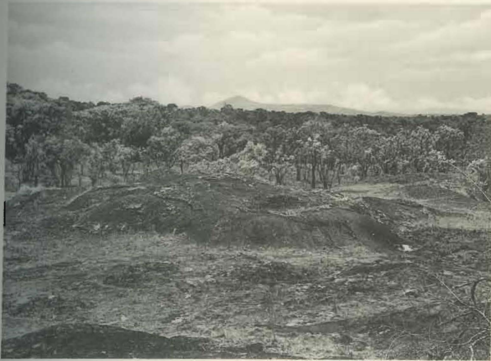
Fig. 1. — Région de la rivière Kande.