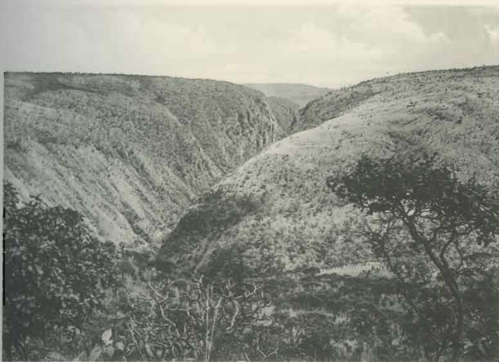
Fig. 2. — Gorges de la Pelenge, vue générale.