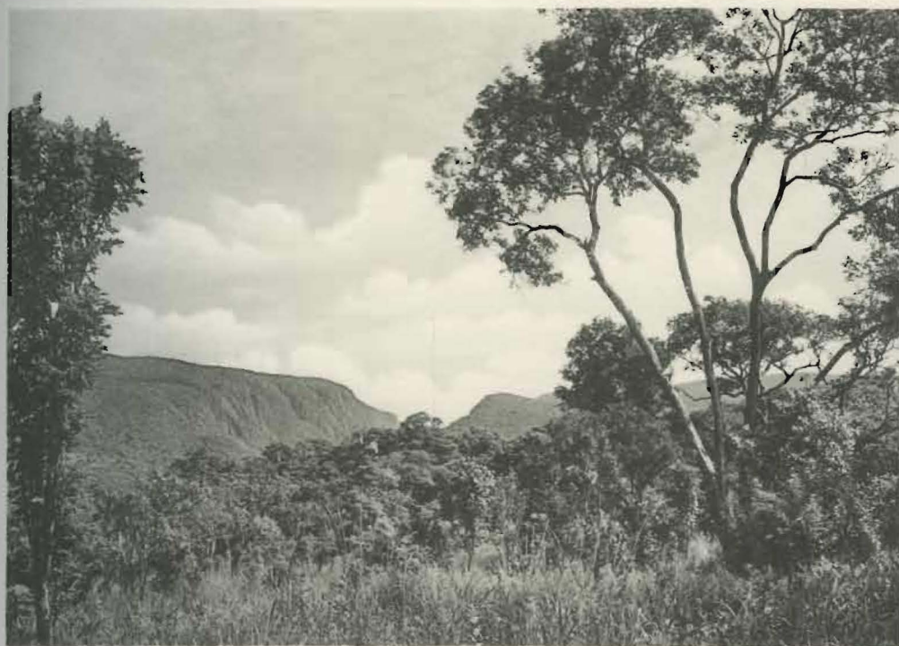
Fig. 2. — Région de Kaziba.