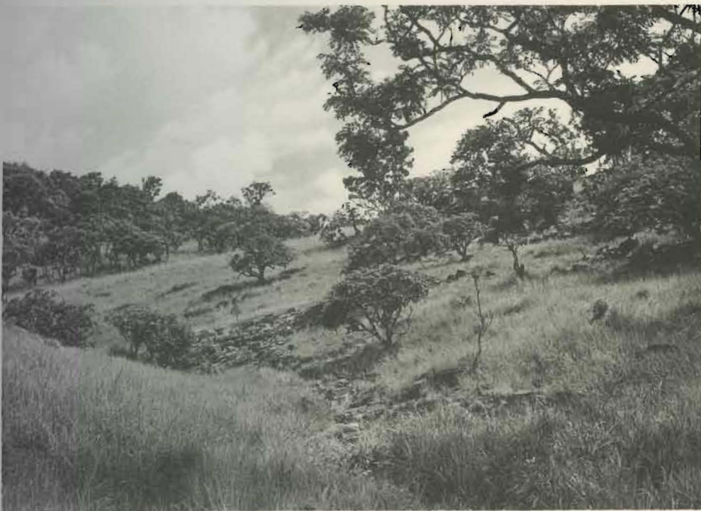
Fig. 1. — Région de la rivière Kankunda.

L. VAN MEEL et R. VERHEYEN (1946-1949). Fasc. 10.