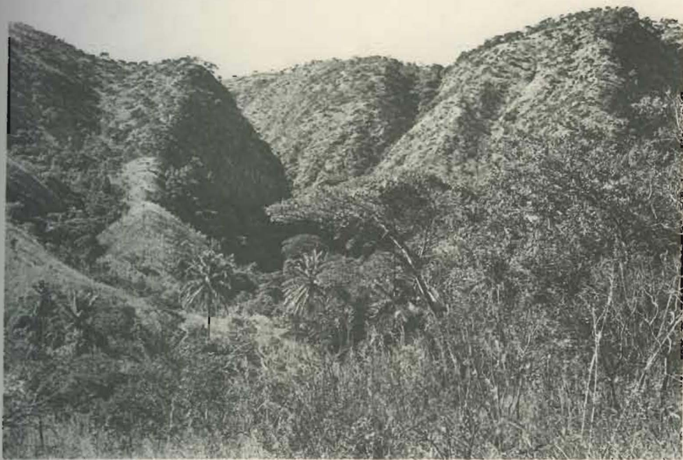
Fig. 1. — Gorges de la Pelenge.