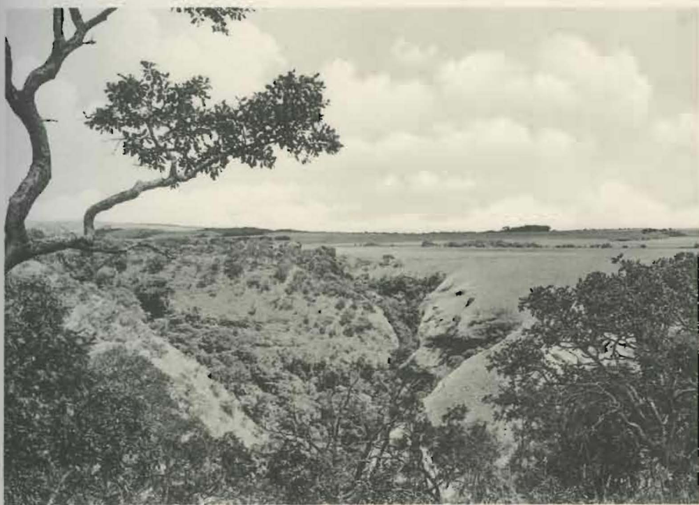
Fig. 2. — En aval du camp de la Muye.