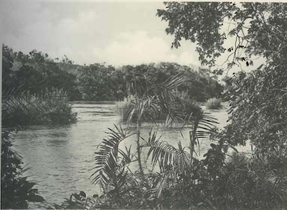
Fig. 2. — Rivière Lufira à Kaswabilenga.