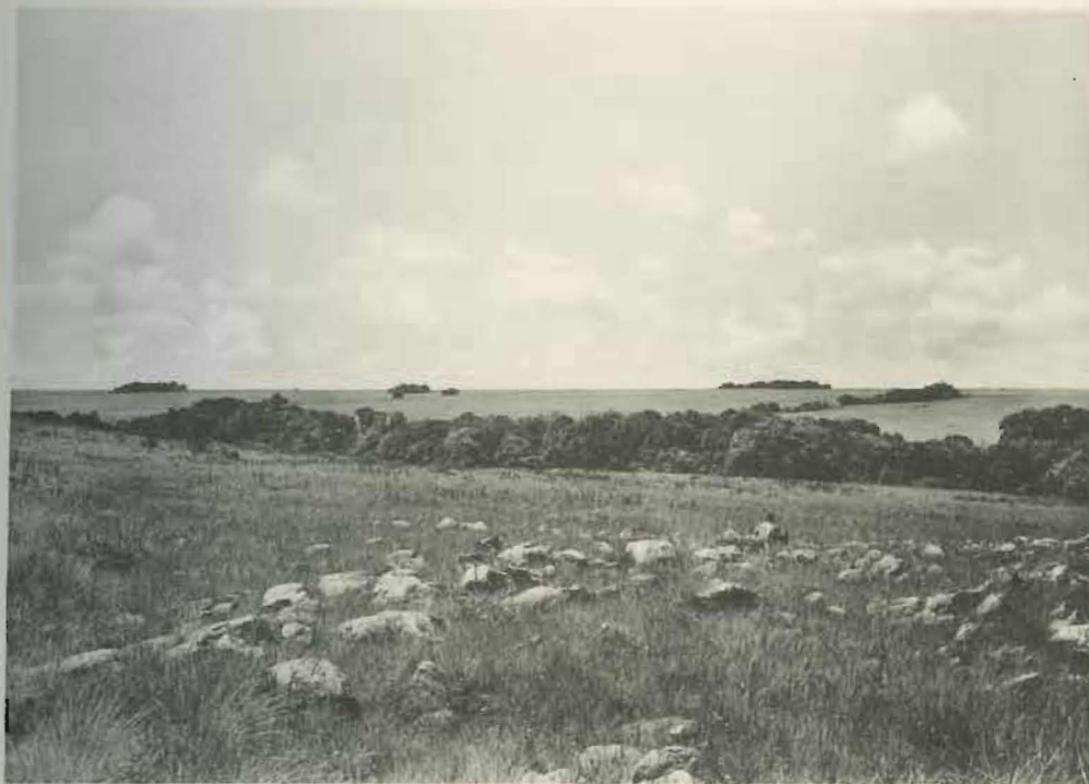
Fig. 1. — Galerie forestière de la Katongo.