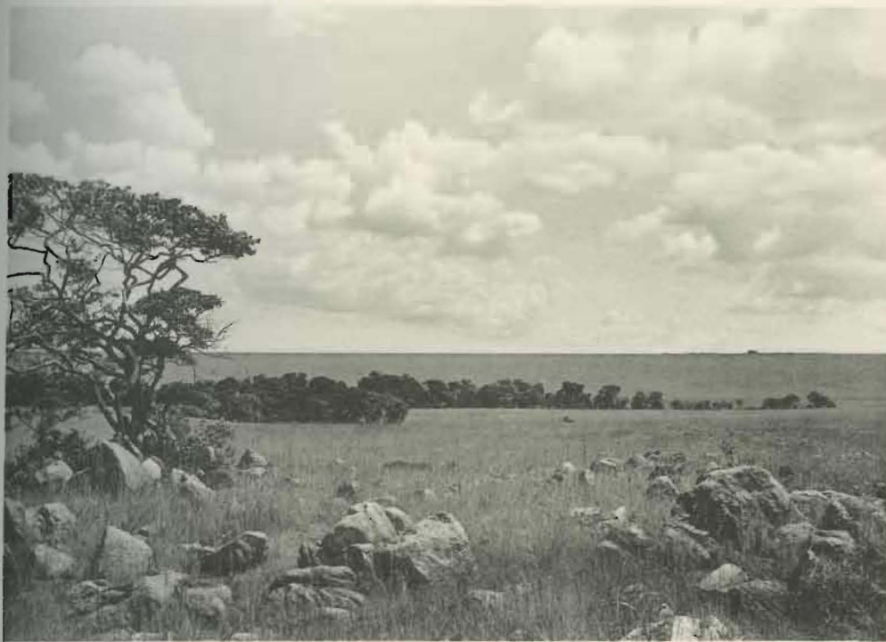
Fig. 1 — Têtes de source de la Buye-Bala.