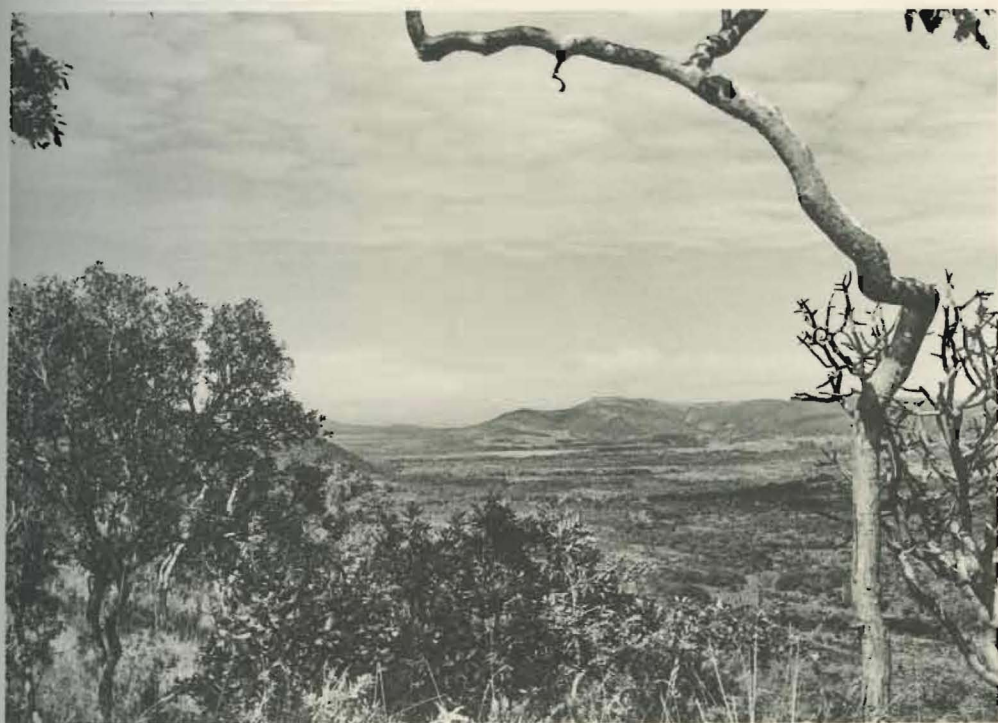
Fig. 1. — Région de Kabwe (riv. Muye).