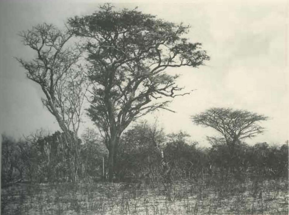
Fig. 2. — Forêt claire de savane au Sud de Mabwe.