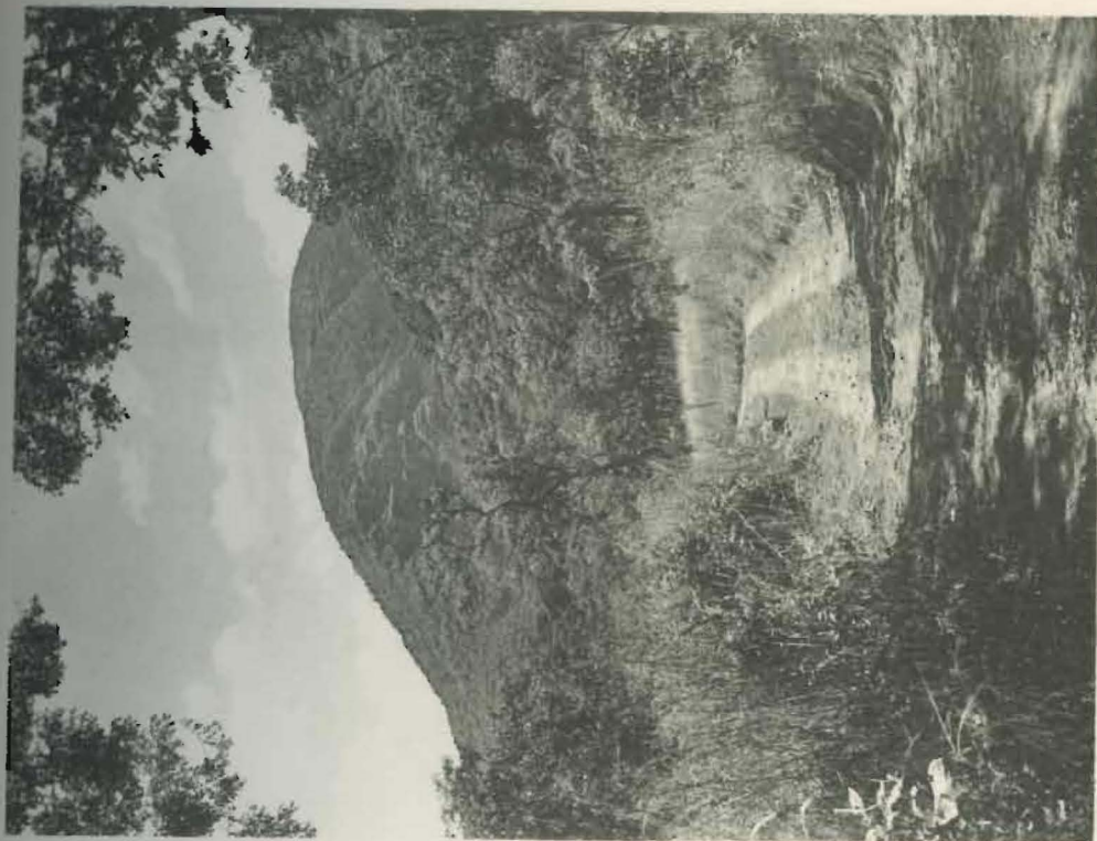
Fig. 2. — Escarpement de la Kibanga.