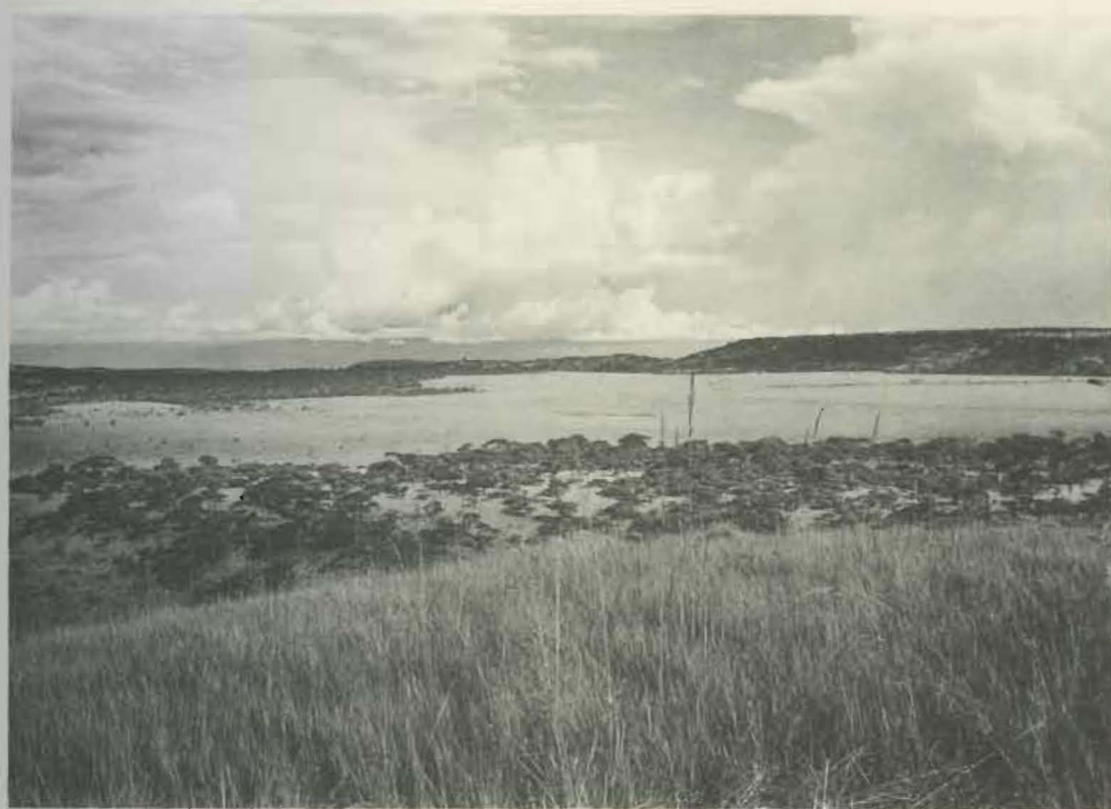
Fig. 2. — Environs de Lusinga.