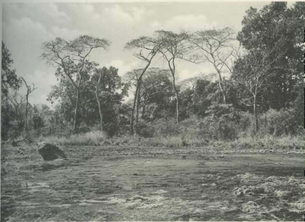
Fig. 2. — Mare en contrebas des salines de Ganza.