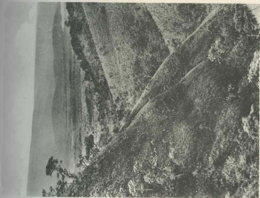
Fig. 1. — Vallée de la rivière Muye.