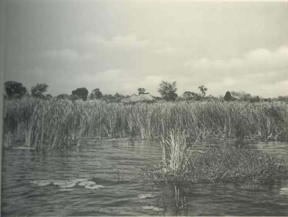
Fig. 1. — Rive orientale du lac Upemba.