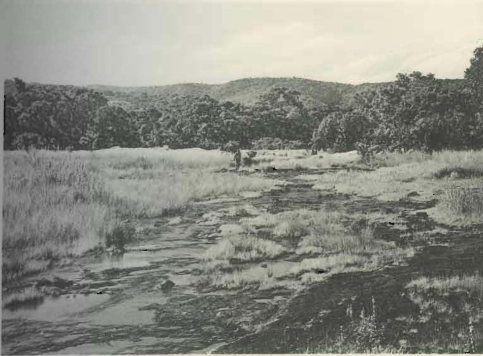
Fig. 1. — Région marécageuse à Kanonga.