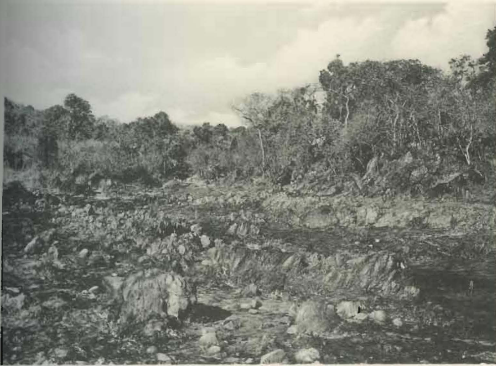
Fig. 1. — Sources salines de Ganza.