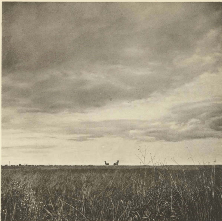
1. Alcelaphus lichtensteini (PETERS). Tête de source de la Kafwi. (Alt. 1780 m.).