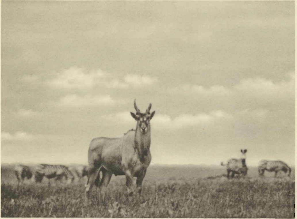
1. Taurotragus oryx (PALLAS). Mâle adulte. Mukana. (Alt. 1810 m.).