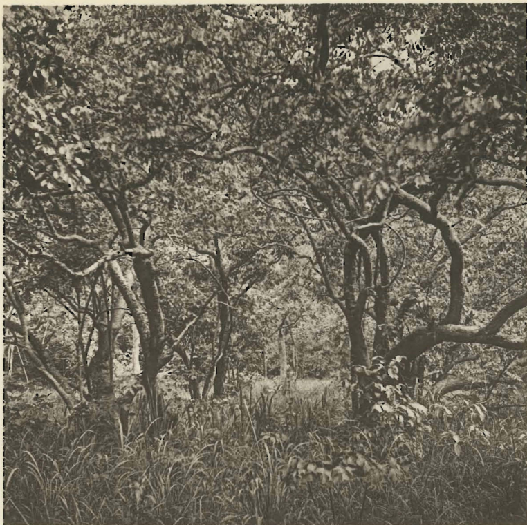
1. La grande forêt katangaise. Mabwe. (Alt. 585 m.).