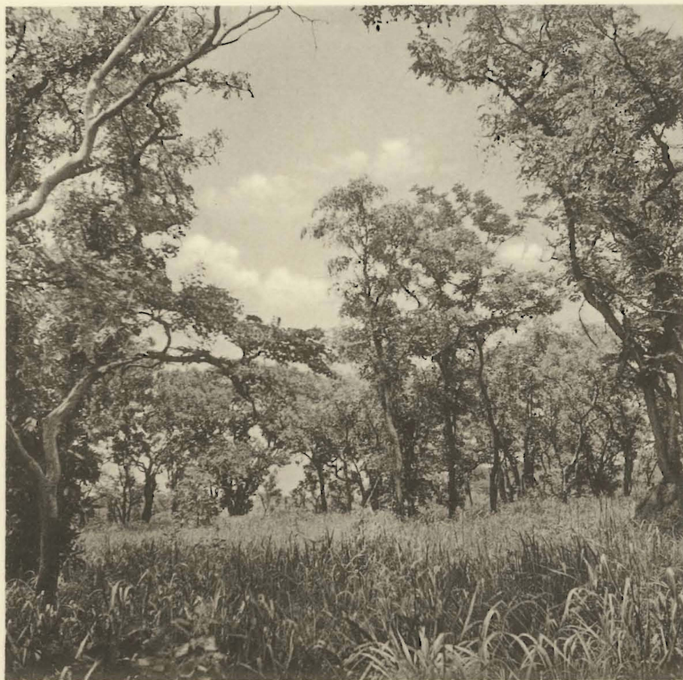
2. Aspect de la savane boisée. Camp du Shinkulu. (Alt. 860 m.).