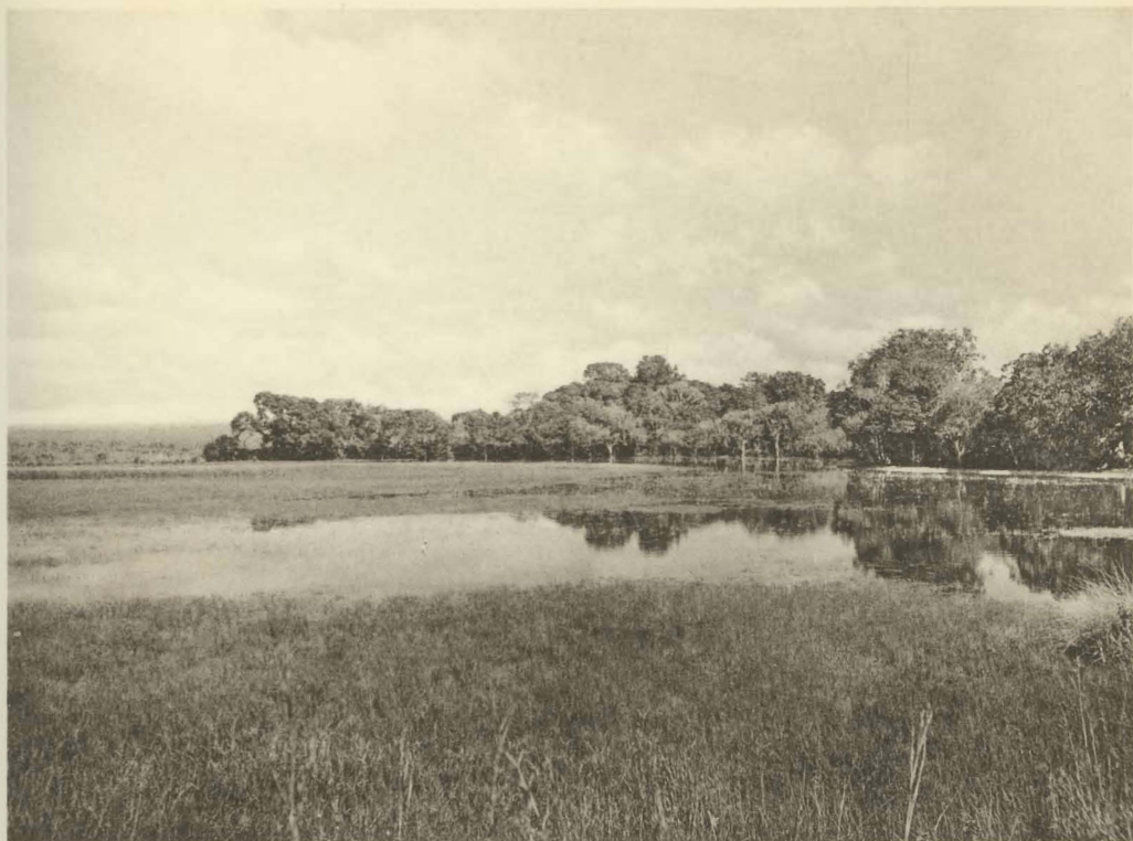
1. Etang de Mukana (Alt. 1810 m.).