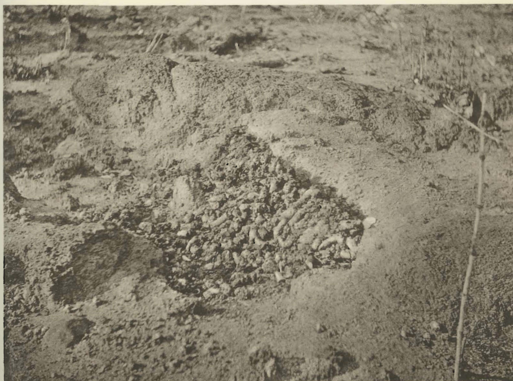
2. Excréments de Viverra civetta SCHREBER, Kanonga. (Alt. 700 m.).