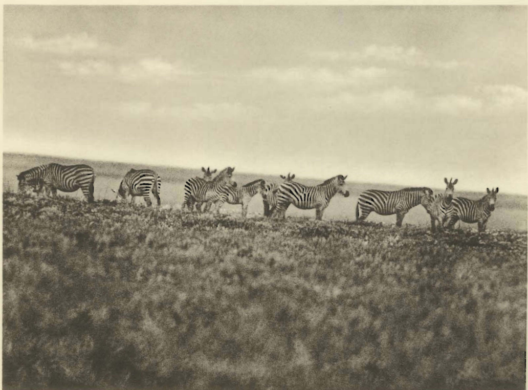
2. Equus (Hippotigris) quagga böhmi MATSCHIE. Un groupe de Zèbres dans la savane herbeuse. Mukana. (Alt. 1810 m.).