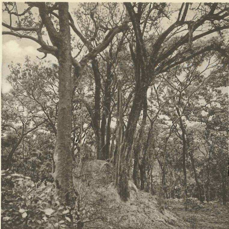
1. Aspect de la forêt katangaise avec termitière. Kaswabilenga. (Alt. 750 m.).