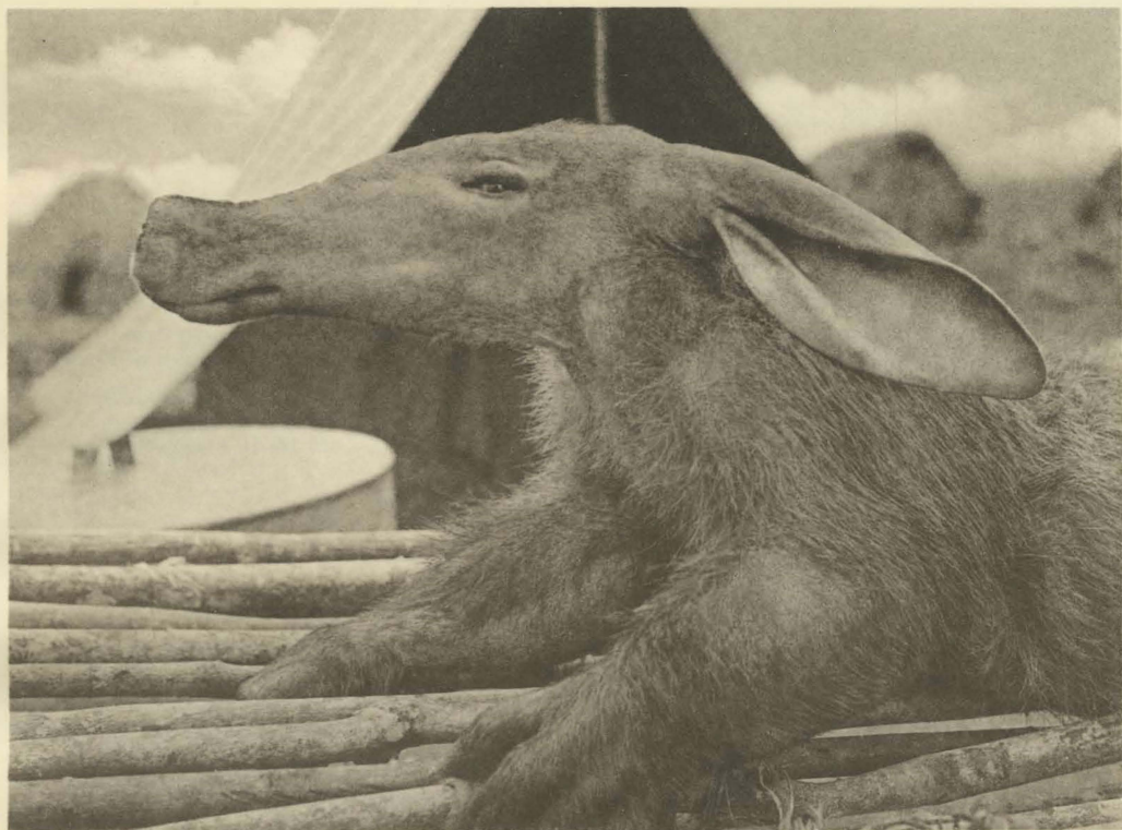
1. Orycteropus afer (PALLAS). Jeune mâle. Tête de source de la Katongo. (Alt. 1750 m.).