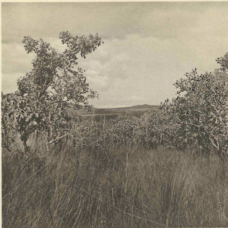
1. Aspect de la savane arbustive. Camp de Kabwe. (Alt. 1600 m.).