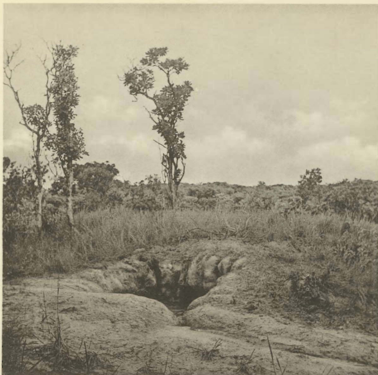
1. Trou creusé par les Eléphants pour atteindre l'eau. Shinkulu. (Alt. 1150 m.).