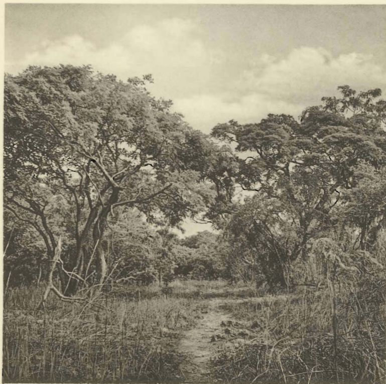
2. Piste d'Eléphants. Kaswabilenga. (Alt. 740 m.).