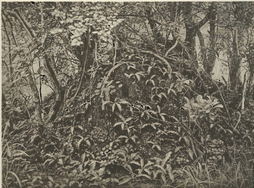
2. Termitière avec végétation caractéristique. Kanonga. (Alt. 695 m.).