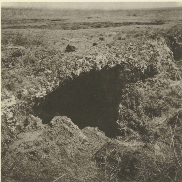
2. Grotte naturelle en savane herbeuse. Tête de source de la Kafwi. (Alt. 1780 m.).