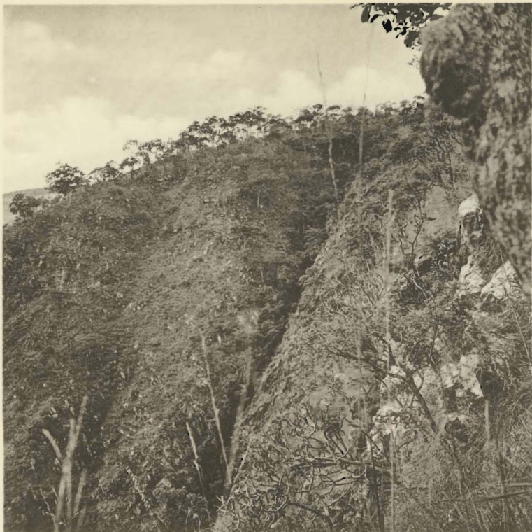
1. Type d'érosion, fréquent en bordure du haut-plateau. Camp de la Pelenge. (Alt. 1400 m.),