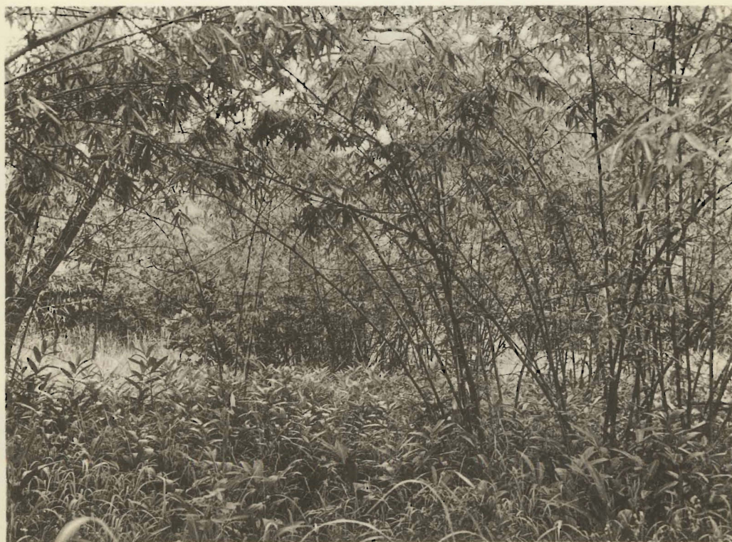
2. Peuplement de faux-bambous. Kanonga. (Alt. 695 m.).