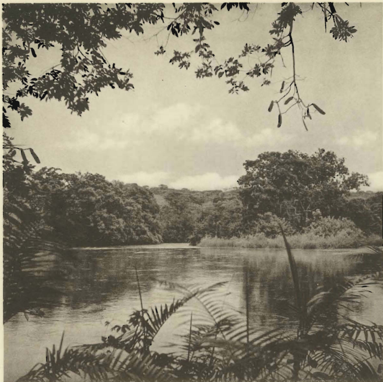
1. La Lufira. Kaswabilenga. (Alt. 700 m.).