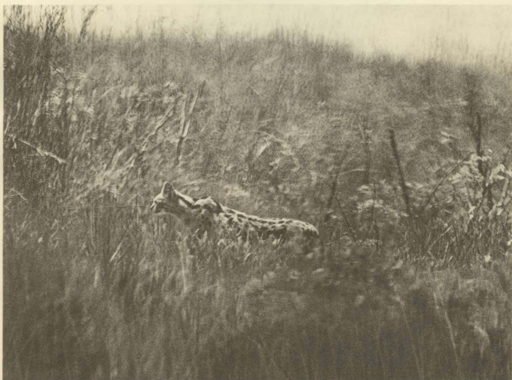
2. Leptailurus serval (SCHREBER). Mukana. (Alt. 1810 m.).