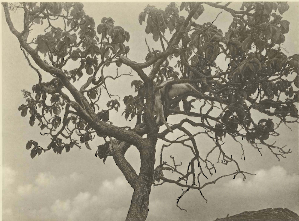
1. Corps d' Ourebia ourebi (ZIMMERMANN) déposé dans un arbre par un Léopard. Panthera pardus (LINNÉ). Lusinga. (Alt. 1760 m.).