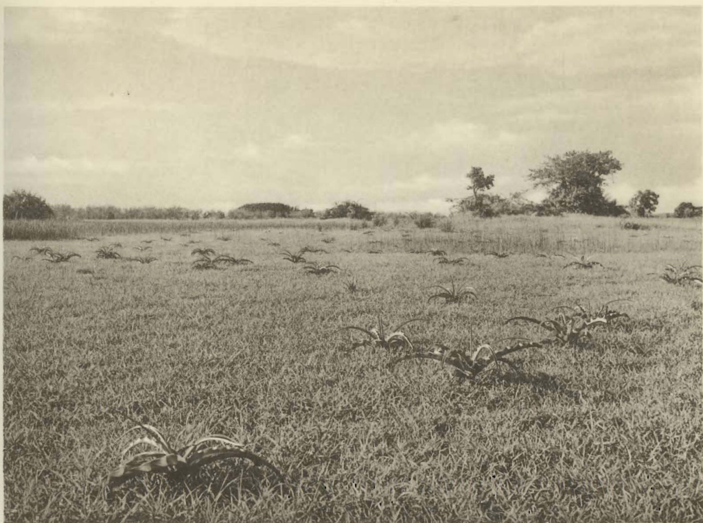
1. Savane herbeuse secondaire en bordure du lac Upemba, Mabwe. (Alt. 585 m.).