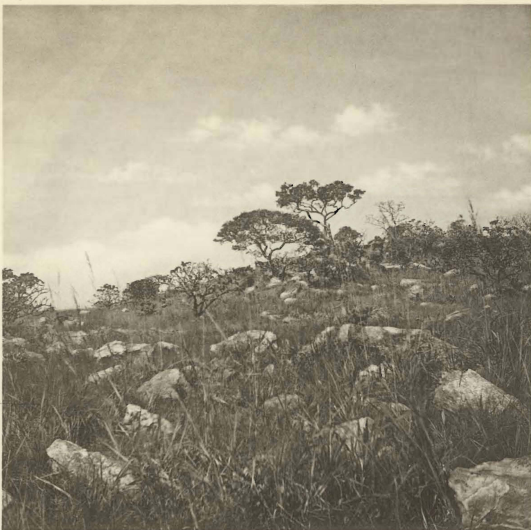
1. Type de paysage en bordure du haut-plateau des Kibara. (Alt. 1600 m.).