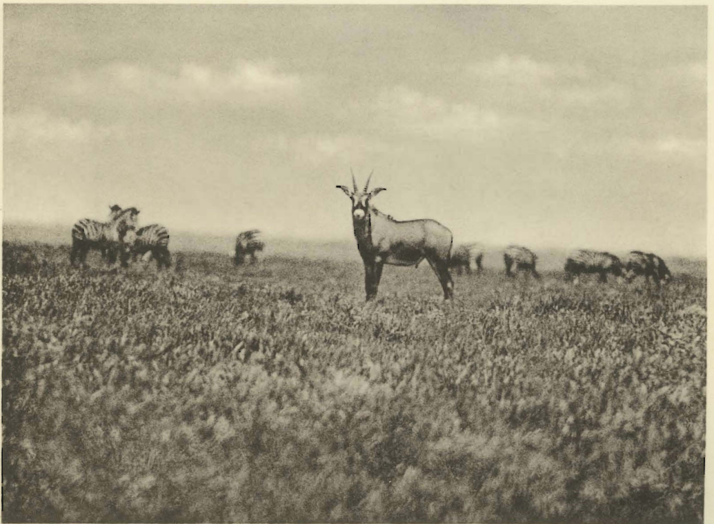
2. Hippotragus equinus (DESMAREST). Jeune mâle. Mukana. (Alt. 1810 m.).