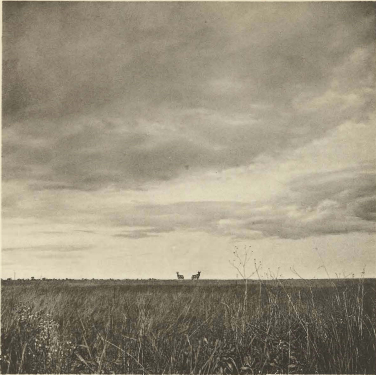
1. Alcelaphus lichtensteini (PETERS). Tête de source de la Kafwi. (Alt. 1780 m.).