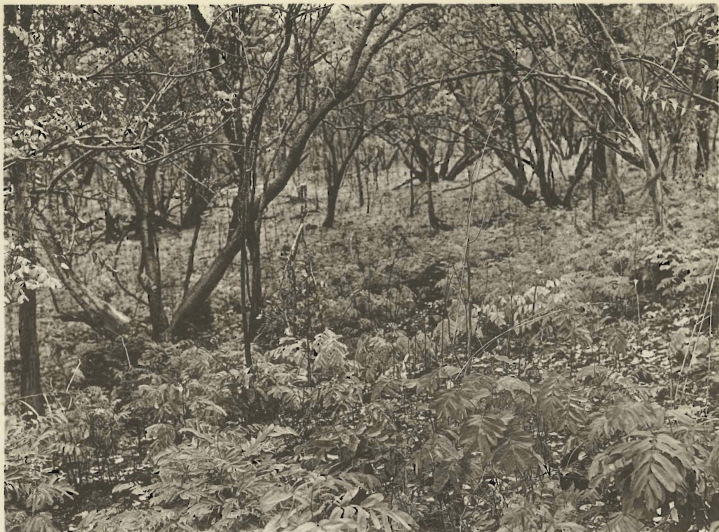
1. Sous-bois dans la forêt katangaise. Mabwe. (Alt. 650 m.).