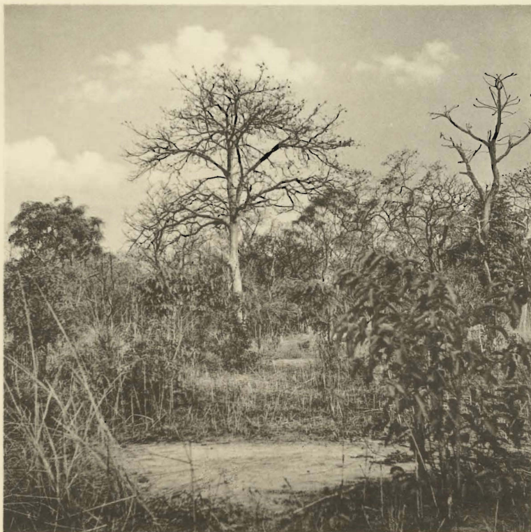
2. Endroit dénudé de végétation où des Phacochères venaient se rouler. Mabwe. (Alt. 585 m.).