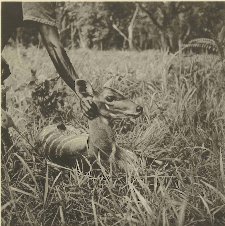
1. Tragelaphus scriptus (PALLAS). Femelle adulte. Mabwe. (Alt. 585 m.).