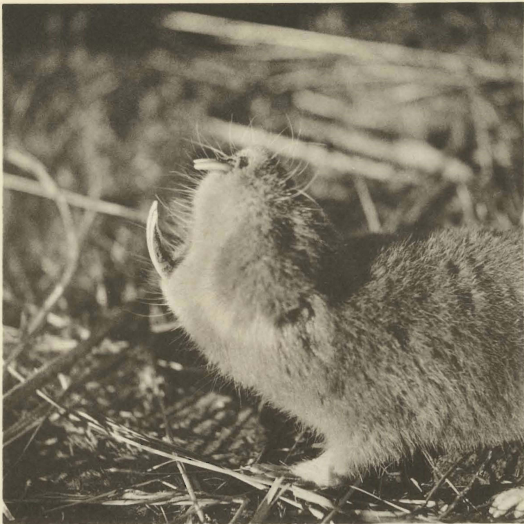
1. Heliophobius argenteocinereus PETERS. Camp de la Mubale. (Alt. 1480 m.).