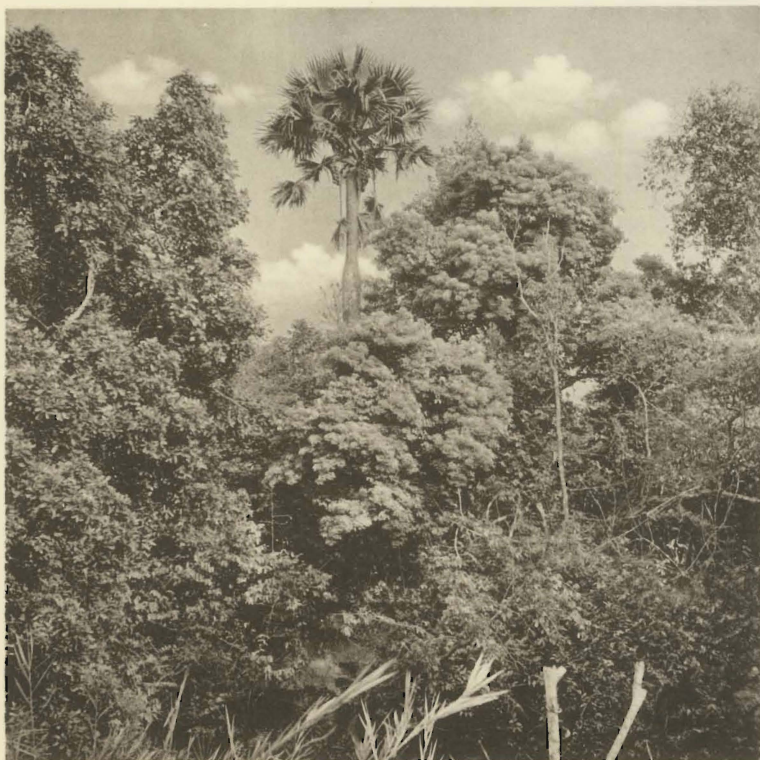
2. Forêt en galerie de la Fungwe. (Alt. 700 m.).