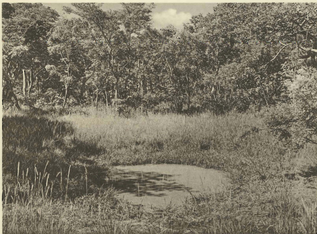
2. Mare en forêt katangaise au Sud de Mabwe. (Alt. 585 m.).