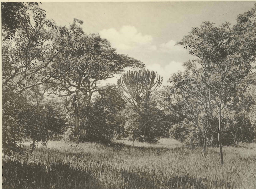
1. La forêt-parc katangaise. Mabwe. (Alt. 585 m.).