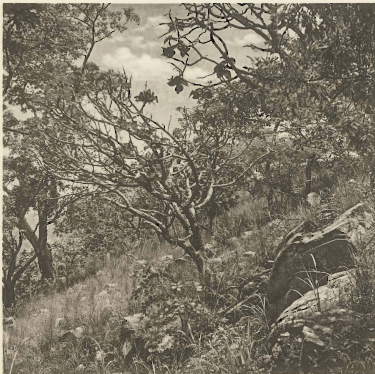
2. Habitat du Klipspringer, Oreotragus oreotragus (ZIMMERMANN). Kaziba. (Alt. 1140 m.).