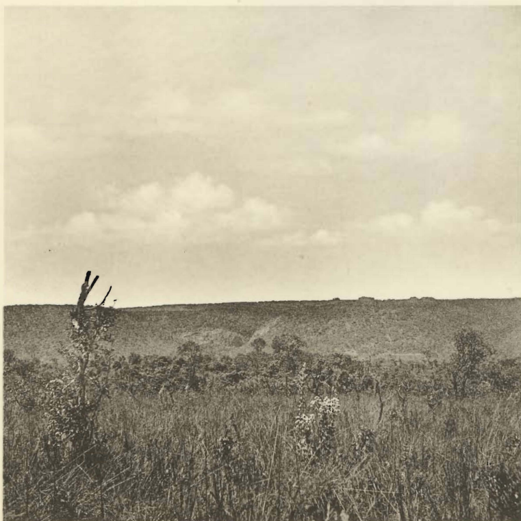
2. Effet de l'action des vents alizés sur la végétation des savanes boisées. Vallée de la Muye. (Alt. 1320 m.).