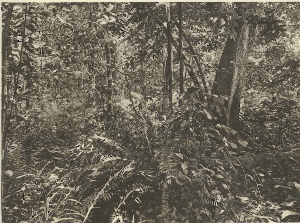
2. Forêt en galerie de la Mweleshi, affluent de la Senze. (Alt. 1140 m.).