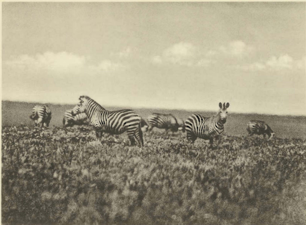
1. Equus (Hippotigris) quagga böhmi MATSCHIE. Un groupe de Zèbres dans la savane herbeuse. Mukana. (Alt. 1810 m.).