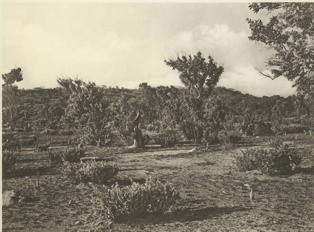
2. Dégradation du tapis végétal sous l'effet des vents alizés. Kanonga. (Alt. 695 m.).