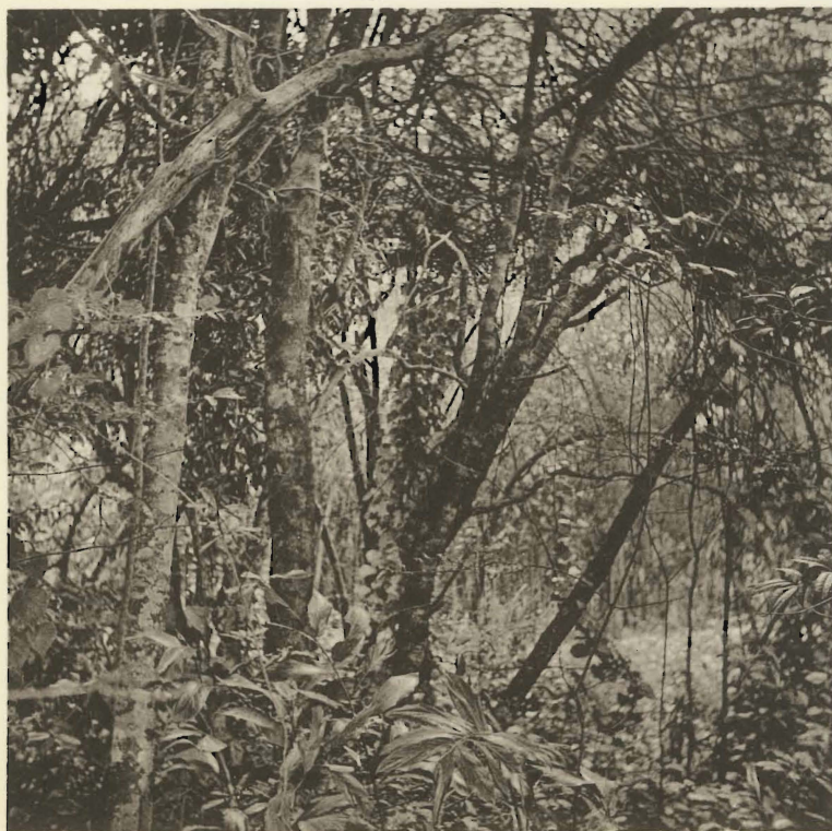
2. Forêt marécageuse. Kabwekanono. (Alt. 1815 m.).