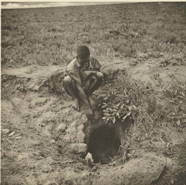
2. Terrier de Phacochoerus aethiopicus (PALLAS), Mukana. (Alt. 1810 m.).