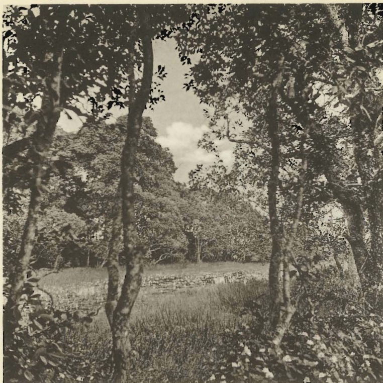
1. Etang temporaire. Camp de la Mbuywe-Bala. (Alt. 1750 m.).