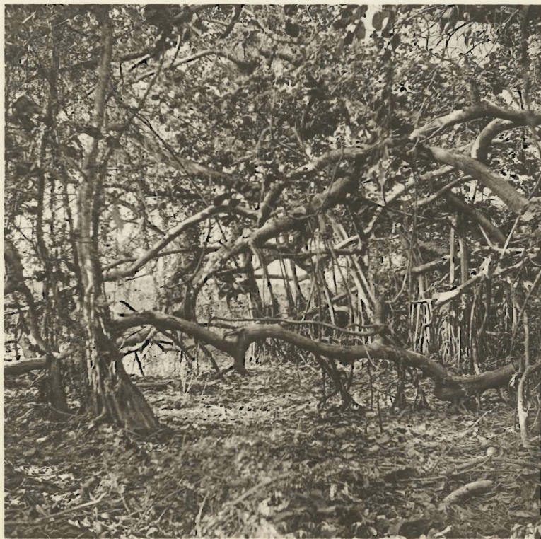
2. Intérieur de forêt marécageuse. Mabwe. (Alt. 585 m.).