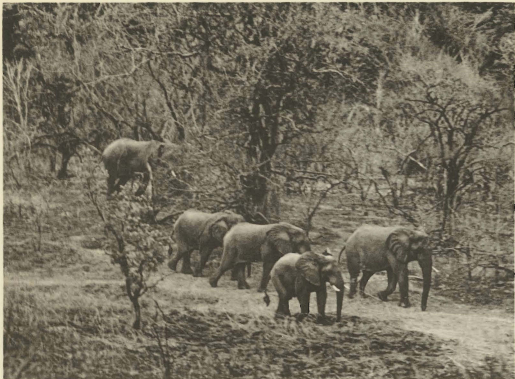
1. Loxodonta africana (BLUMENBACH). Vallée de la Senze. (Alt. 800 m.).