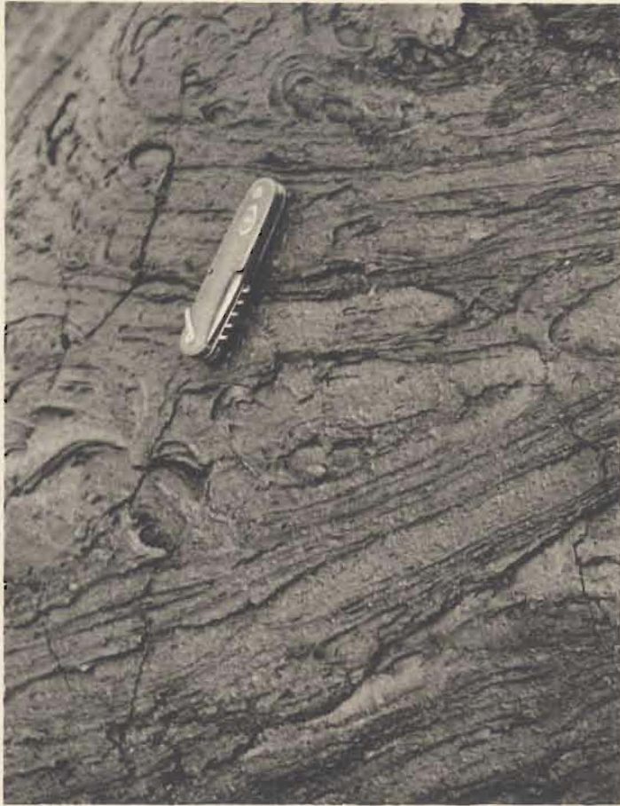
1. Aspect de lave.