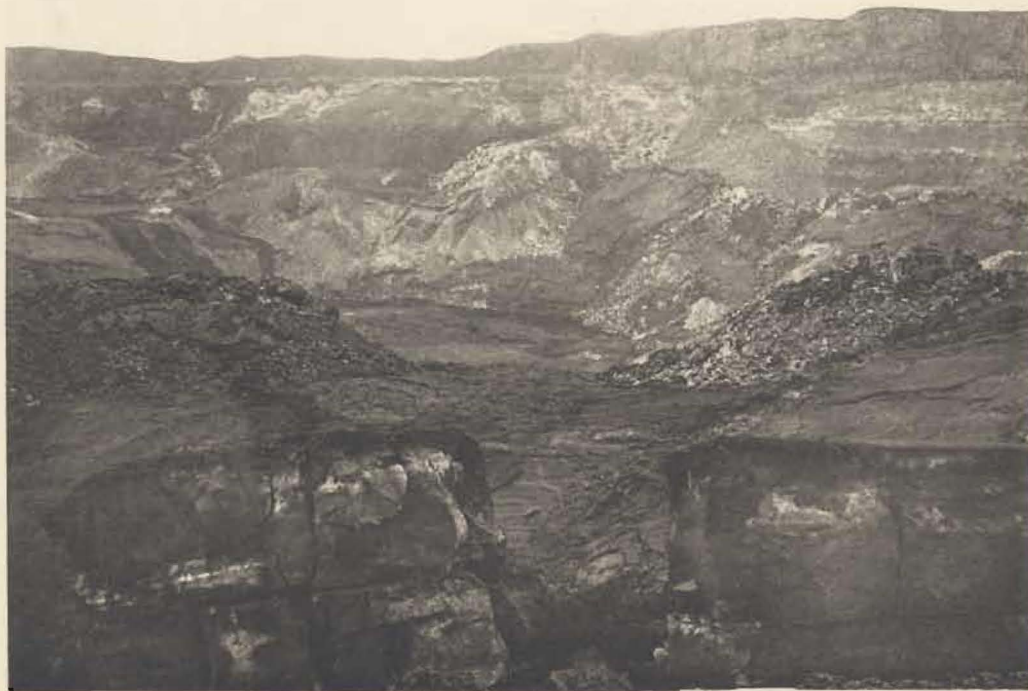
2. Février 1938. Nouvelle plate-forme inférieure.