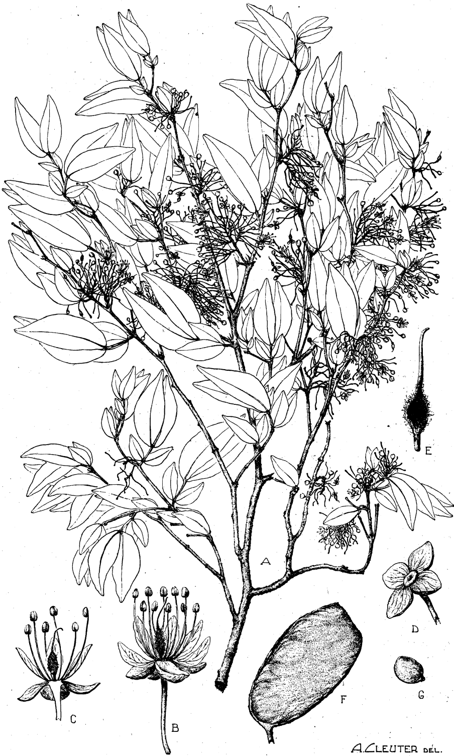
Cynometra Alexandri C. H. WRIGHT

A. Branche florifère (× 1/2). — B. Fleur épanouie (× 2). — C. Fleur épanouie, coupe longitudinale (× 2). — D. Calice (× 2). — E. Gynécée (× 4). — F. Gousse (× 1/2). — G. Graine (× 1/2). — D'après LEBRUN 4361.