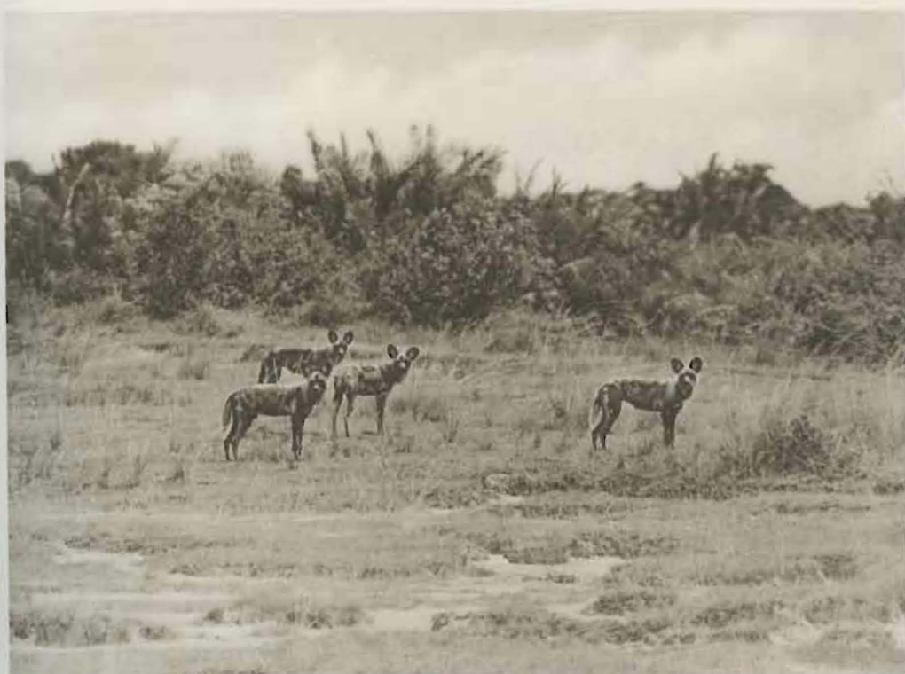
Fig. 90ter. — Lycaons ( Lycaon pictus lupinus THOMAS).