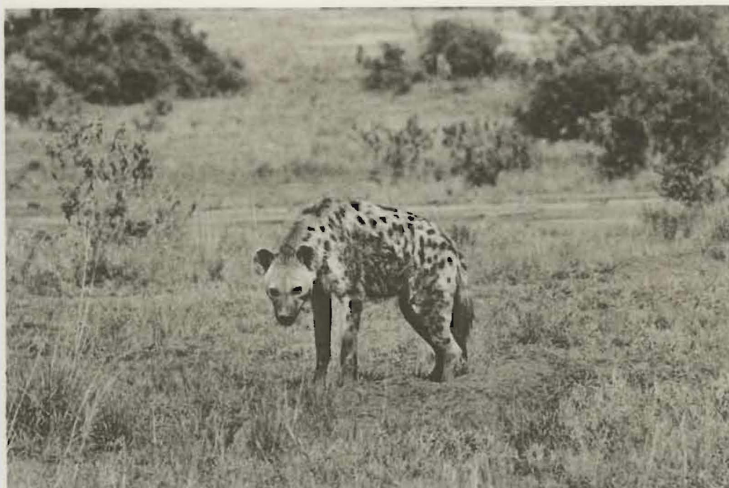
Fig. 90. — Attitude caractéristique d'une Hyène tachetée.