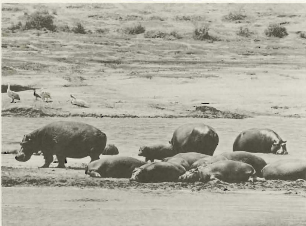
Fig. 44. — Groupe d'Hippopotames d'âges différents.