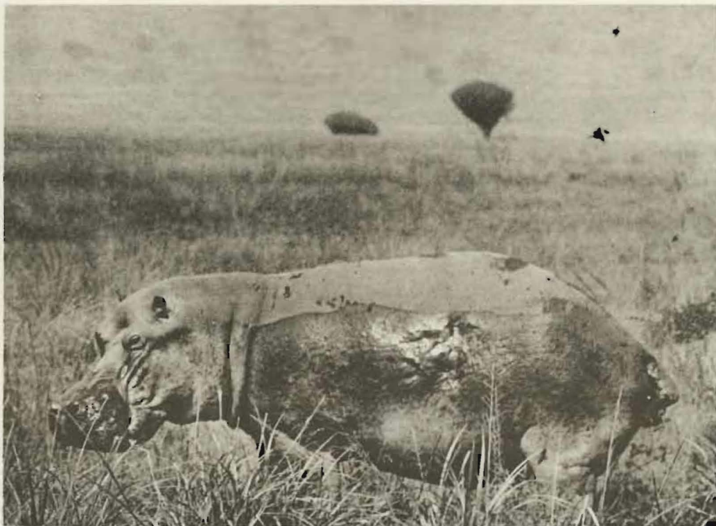
Fig. 41. — Hippopotame sortant de sa bauge ( Hippopotamus amphibius LINNE).