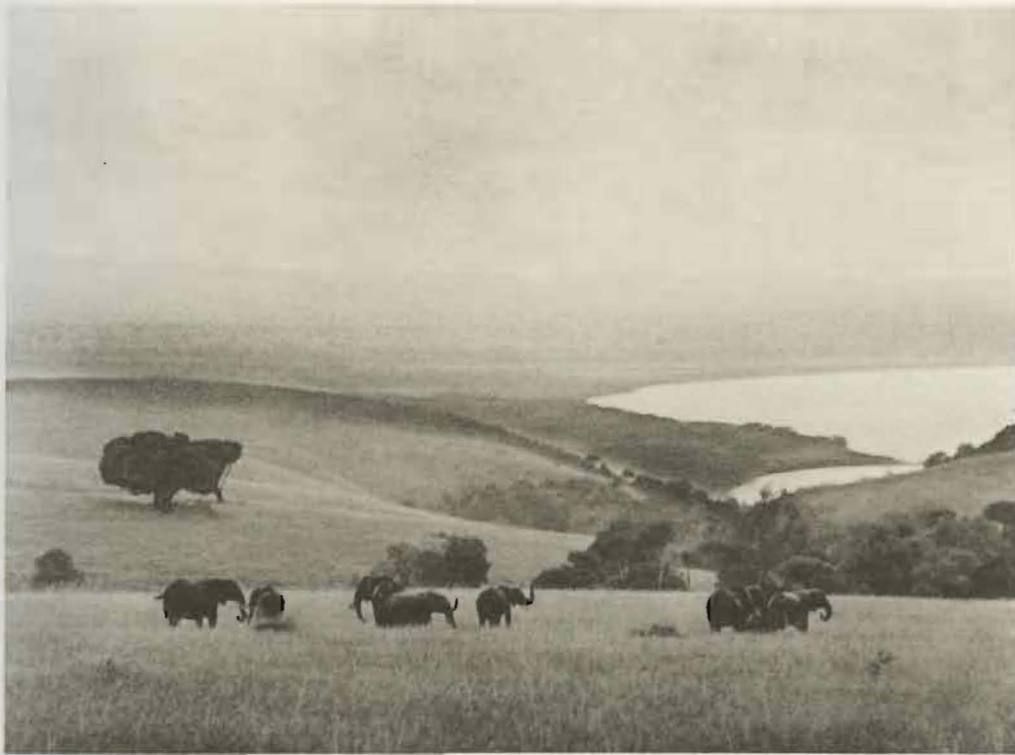
Fig. 3. — Eléphants dans les monts Bukuku.