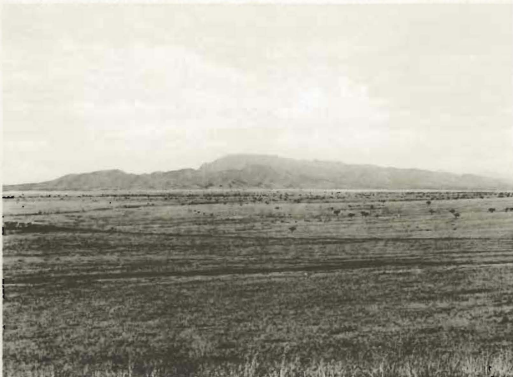
Fig. 24. — Le même paysage vingt-cinq ans après (1959).