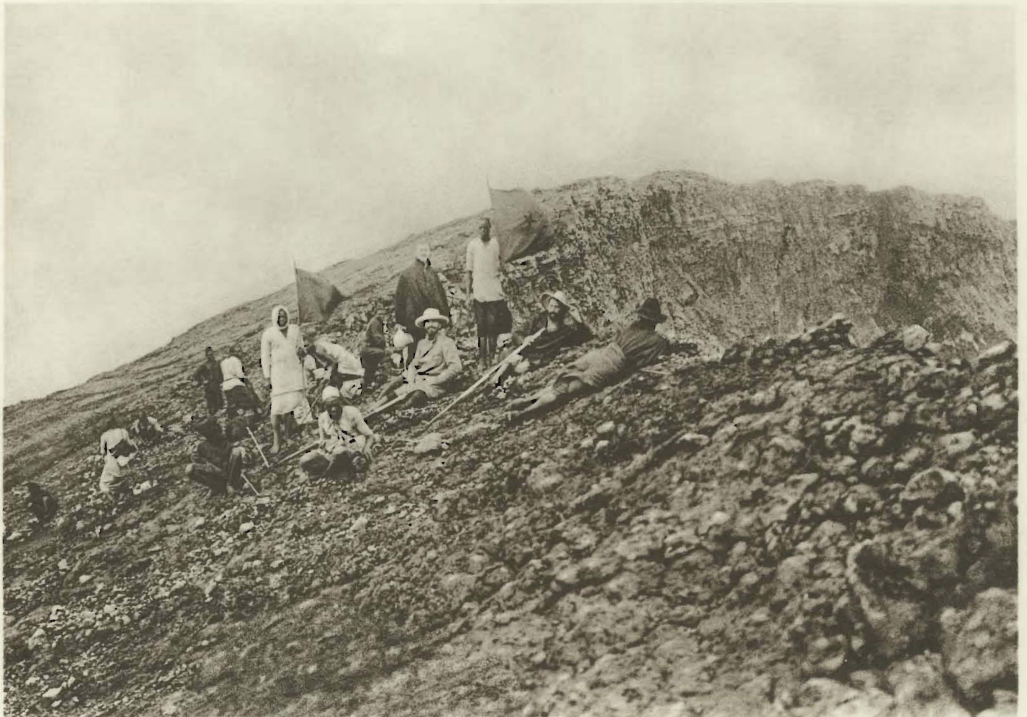
2. Au bord du cratère du volcan Nyamuragira ou du Nyiragongo.