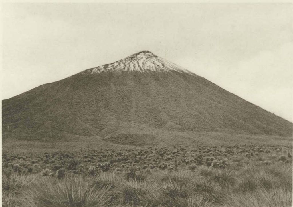
2. Le volcan Karisimbi.