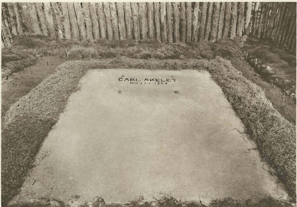
2. La tombe de l'explorateur Carl AKELEY.