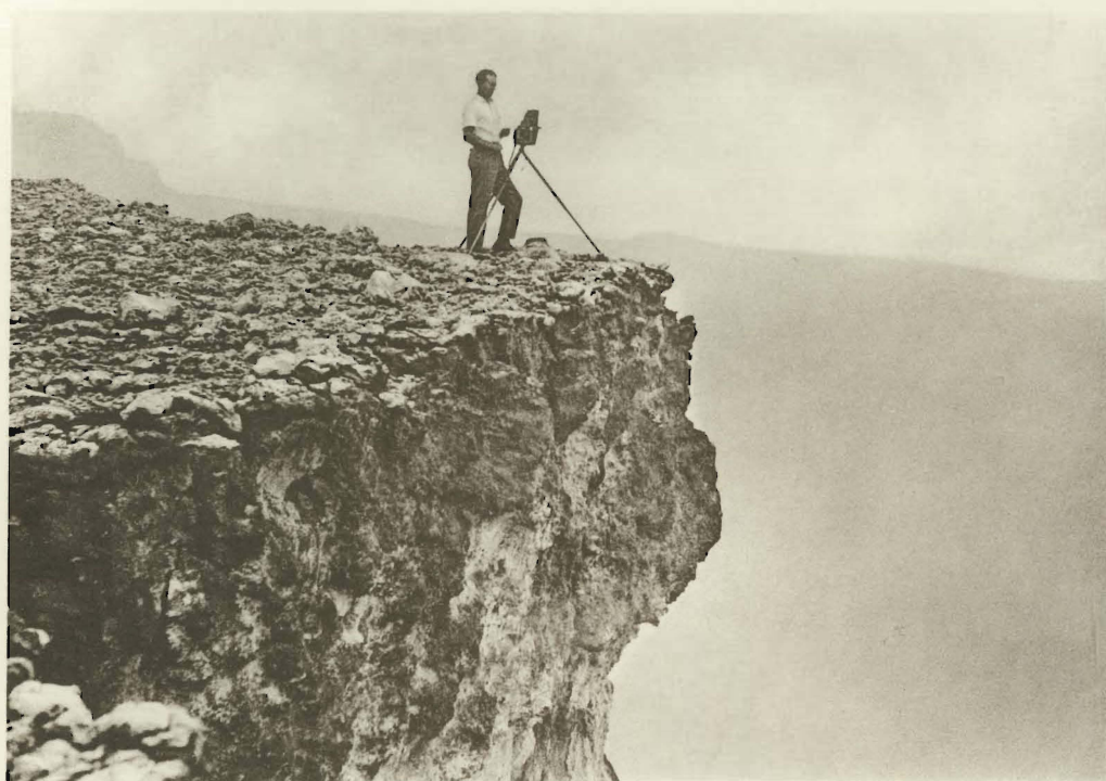
2. Son Altesse Royale le Duc de Brabant.