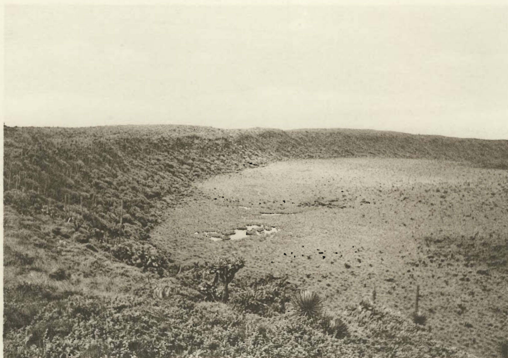
1. Le marais du « Branca-crater ».