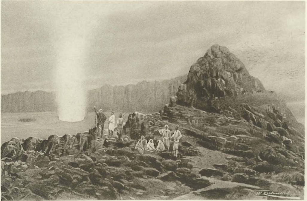
1. Au bord du cratère du volcan Nyiragongo.